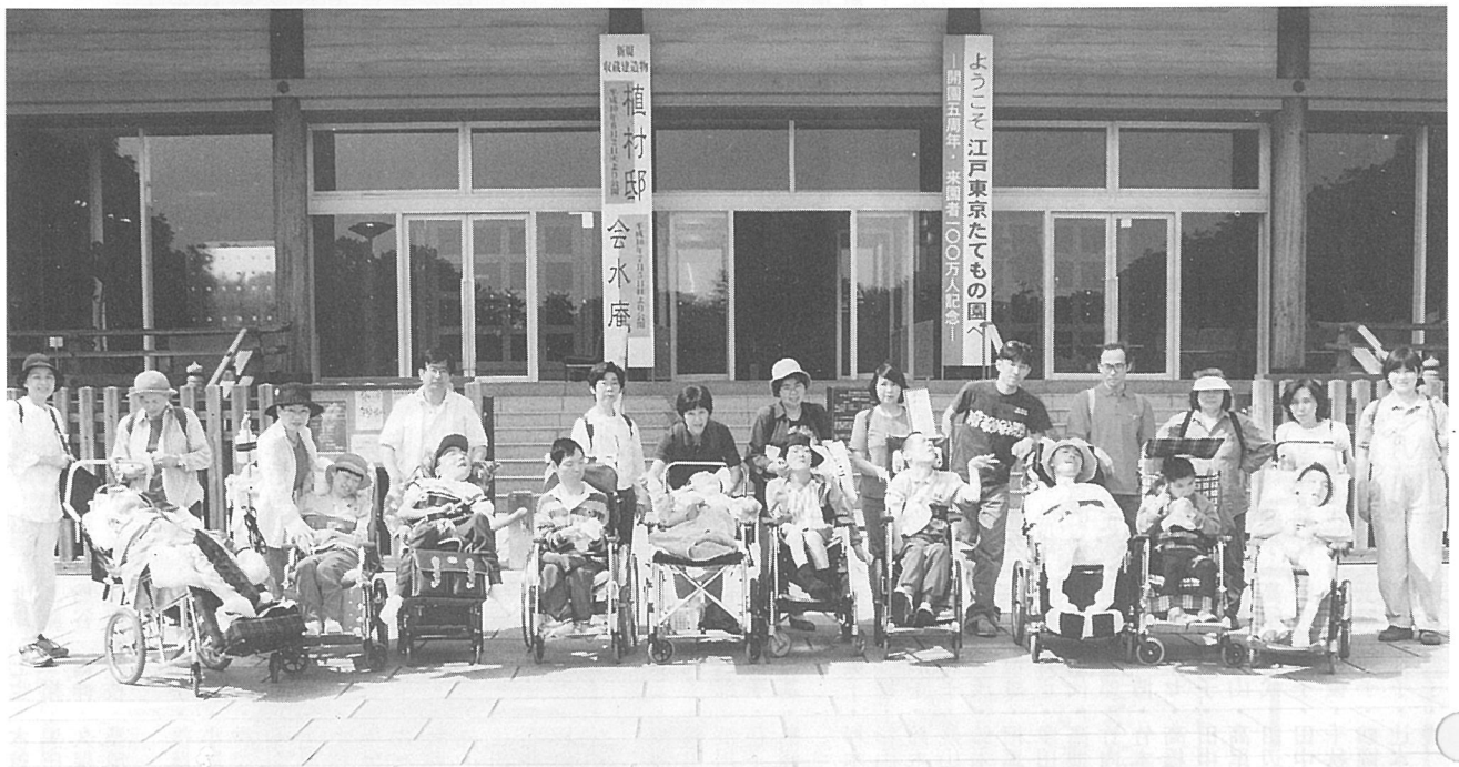
小金井公園内江戸東京たてももの園に行きました