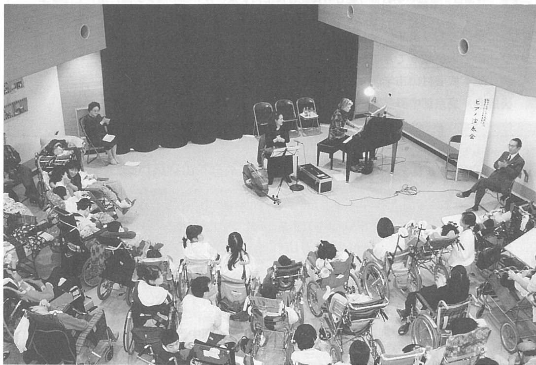
『ピアノ・チェロの演奏会』 通園棟多目的ホールにて

大使夫人の自然ににじみ出たやさしいお人柄が、子供達に伝わって、それはそれは明るくはなやいだ午後でした。 御忙しい御二人が寸暇を割いて御演奏下さった事は、まことの愛を御示して下さいました。 私共も元気を出して勇気を示して、今年も障害児療育のためにつくしていきたく存じます。 皆様方の変らぬ御支援を御願ひ申し上げます。