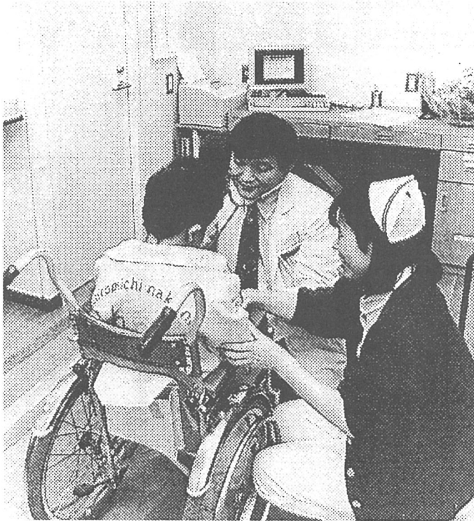
7日、あきる野学園養護学校に開設された診療所