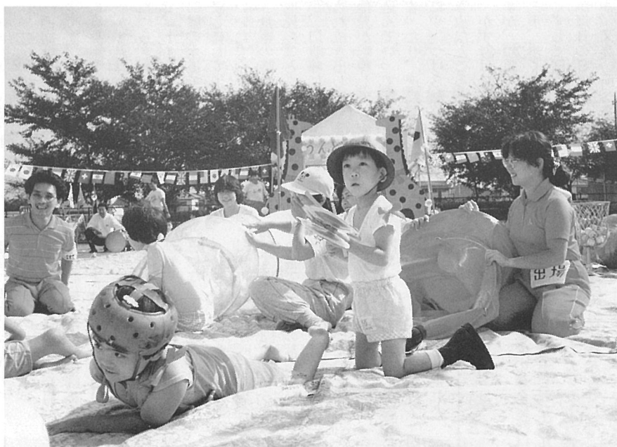
運動会と西病棟のこどもたち