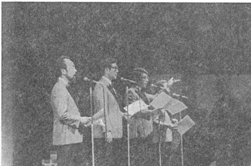
ボニージャックス