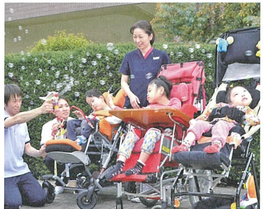
グループ活動風景