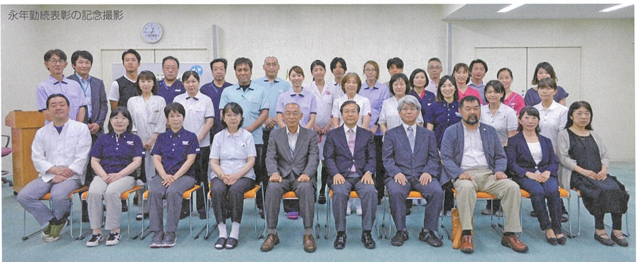
永年勤続表彰の記念撮影