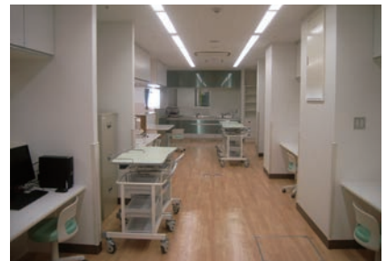
西1病棟 ナースステーション