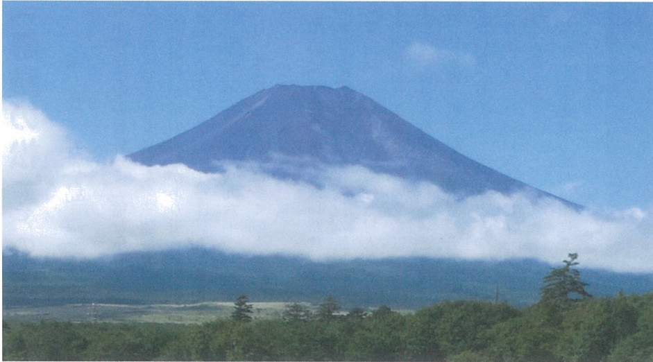
冠雪のない盛夏の富士山