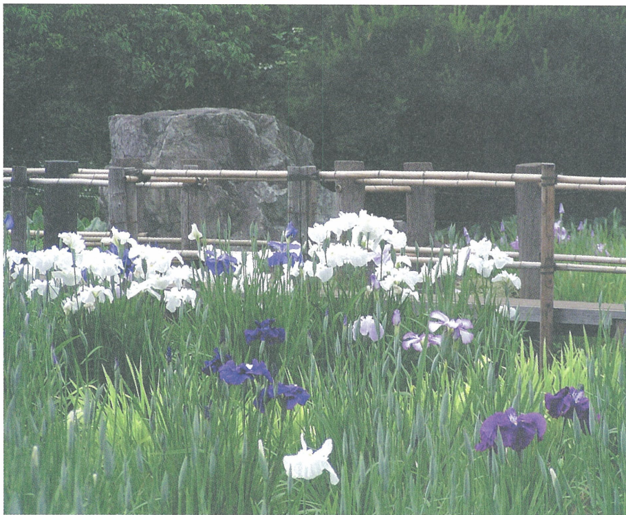
湖南公園にて