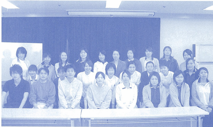
平成20年度の新入職員

四月の一・二日に平成二十年新入職員オリエンテーションを実施しました。対象となった職員は、熱心に講義や実習を受けていました。 二日間のオリエンテーション終了後、通園棟のホールで新入職員歓迎会を行いました。多数職員が出席し、大盛況でした。