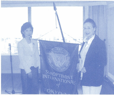
会旗を挟み記念撮影