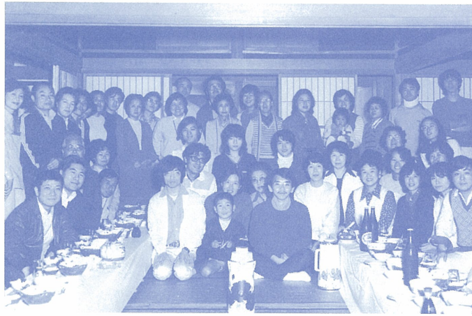
昭和54年当時当時の職員（職員旅行にて）

徐々に障害児（者）福祉にも及んでくるでしょう。あの時代へ戻らないためには何をしなければいけないか？何をしなければいけないかを一歩、一歩確認しながら歩んで行こうと思う今日この頃です。