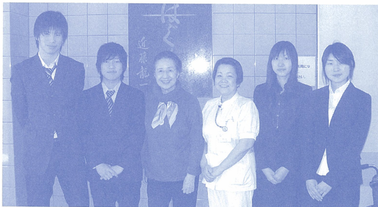
東邦大学大森祭実行委員のみなさん