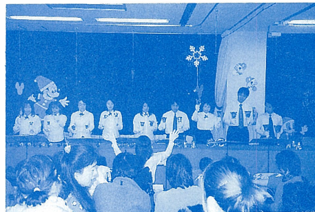
H14年 クリスマス会 風景

ための、調理方法が要求され、実施しています。又、年間を通してバイキング形式で行事食も行い大変喜ばれています。今後、益々、利用者の希望が叶えられるように創意工夫し真心がこもった食事作り而努力したいと給食スタッフ全員が考えています。