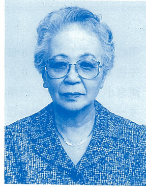
社会福祉法人 鶴風会